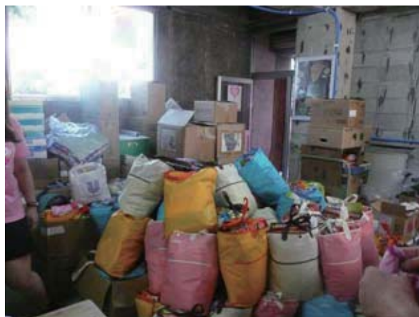
寄付で集められた物資

支援物資が届き始めて間もない時期は、安全管理や配布時の秩序を保つためという理由で男性だけが物資担当になることが多いようですが、女性が受け取りにくいと