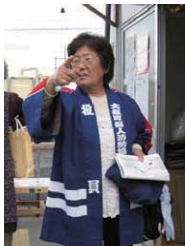
岩手県大船町の女性リーダー

宮城県のある避難所では、避難者が共同で使用する機器の管理をしていた女性が5～6名いたので、彼女たちにリーダーとして相談のとりまとめをしてもらいました。ひとりひとりが相談すると、個人の苦情として受け取られがちで、対応も困難です。しかし、女性たちが相談を取りまとめるこ