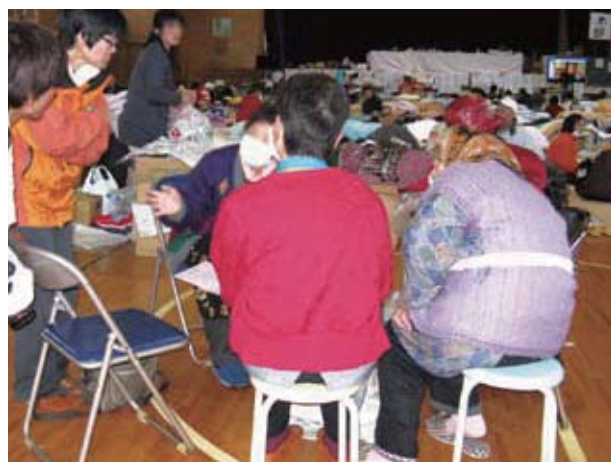
避難所での聞き取り

災害時に状況が把握できない中で職員を派遣する際、安全確保は大切な問題ですが、それは組織として男女を問わず対策を講ずるべき課題です。「職員として現場に行くことは当然。女性職員が迅速にニーズ調査に加わらないことで生じる弊害の方がはるかに大きいです」というこの女性の自治体職員の経験からも、その役割の重要性がわかります。