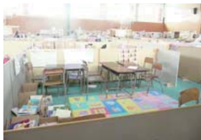
相馬市内避難所の勉強スペース

災害時には、乳幼児など小さいお子さんをもったお母さんの負担と不安は大きく増しますが、混乱がある程度落ち着き、自宅の片付けや復旧作業、各種手続きを行う時期にもこの状況は続きます。仮設住宅が町の中心から離れた所に建設される場合も多く、子どもの預け先が無い、学校までの送