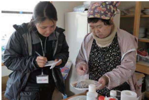
被災地にて聞き取りを行う NICCO 職員

下着のサイズ、いつも使っている生理用品の種類・・・平常時でも人前では口にしづらいものです。ニーズ調査と言われても話したくないのが普通です。そんなときは、困り事や不足している物資にチェック(✓)するだけのリクエスト票を作り、避