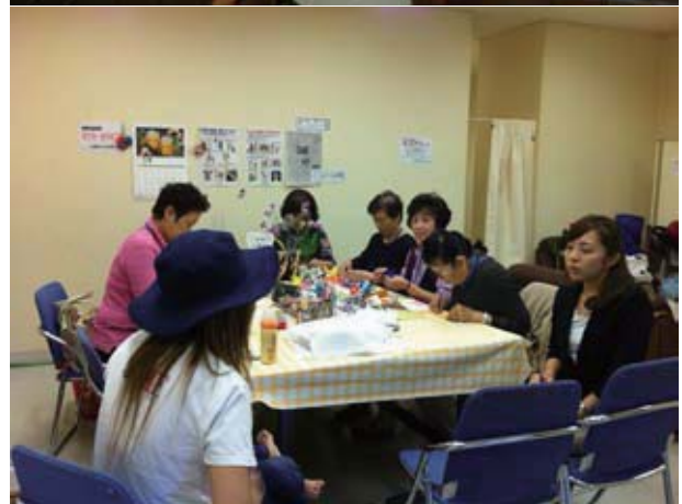
ビッグパレットふくしま避難所「女性専用スペース」