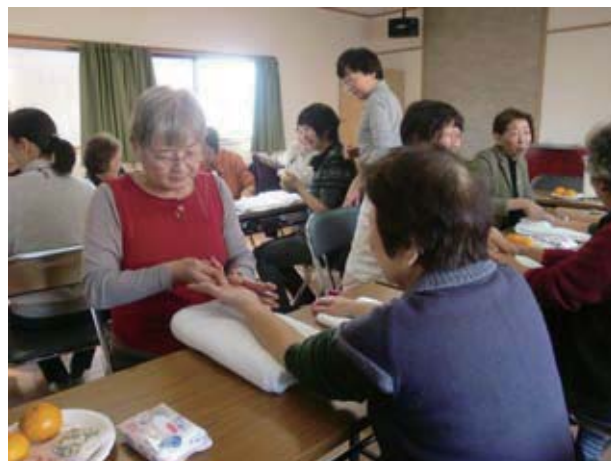
ハンドマッサージなどのワークショップ時には様々なニーズを聴ける場合が多い