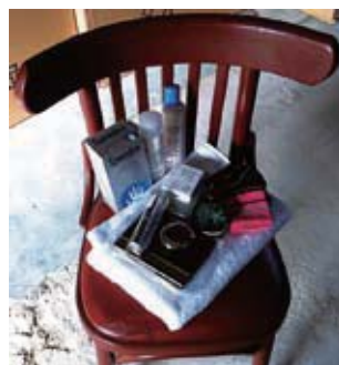
寄付品を詰めあわせたセット。袋はランドリーバッグに使える