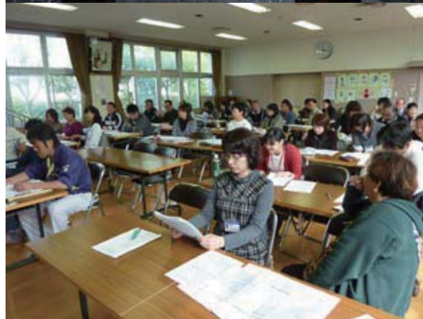
(写真上) 支援員訪問 (写真下) 支援員の研修