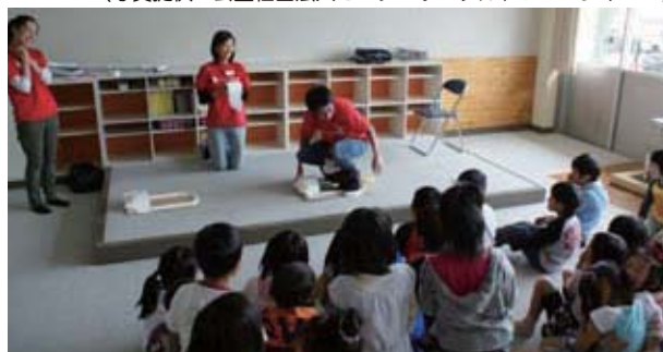
トイレの使い方ワークショップ

レを少しでも快適空間にするための、和式トイレの上に洋式便座をつけるアタッチメントや、ステップを登りやすくする、小型の補助ステップなどを支援物資に入れてもらうよう要請することも可能です。