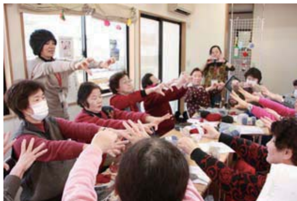
編み物講座途中の体操の様子

この支援団体は、仮設住宅を拠点に様々な支援を行っていますが、常に自治会長さんと相談し、連絡を欠かさずに活動することを心がけています。