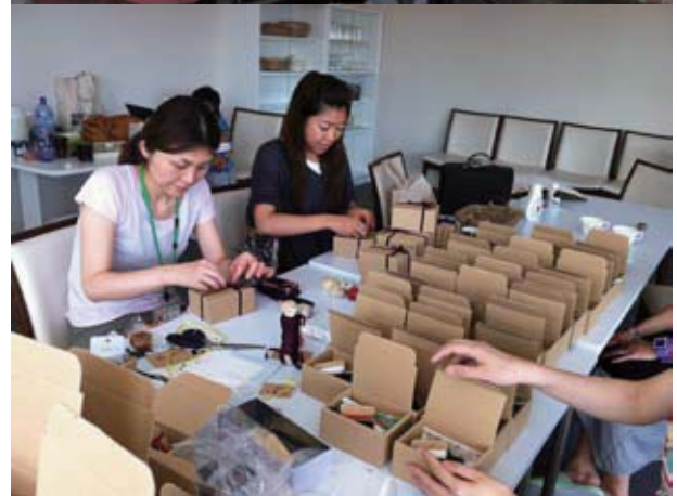
(写真上) 男性も参加した手仕事ワークショップ (写真中) 編み物講座 (写真下) 女性からのニーズが多かった裁縫セットを作っている様子